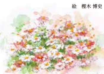
絵 榎木 博史