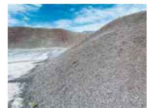
苫小牧港西港区PKSヤード