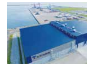
釧路西港木質ペレット倉庫

世界的な環境意識の高まりを受け、PKS(パーム椰子殻)と木質ペレットといったバイオマスエネルギーとなる材料の安定した調達を図り、環境に配慮した事業へと取り組んでいます。また、当社が長年にわたり培ってきたばら積貨物(バルク)の物流や在庫管理、品質管理に関する具体的な技術や知識を通じ、新たに稼働した釧路火力発電所における燃料の安定的な輸送をサポートしています。