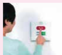
ワイヤレス緊急ボタン