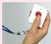
見守りコントローラー