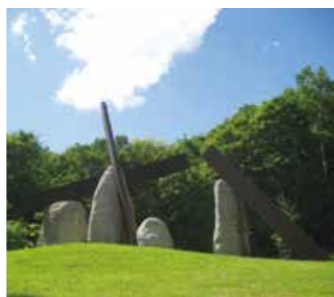
～札幌芸術の森・夏～

青空と木々、野外彫刻の陰影が一段と美しく映える、夏の「札幌芸術の森」。郊外に広がる40ヘクタールの敷地には美術館や各種クラフト工芸などが点在し、札幌における芸術と創作の活動拠点となっています。一見して無造作に置かれた野外美術館の芸術品からは、訪れるたびに新鮮な感動が味わえます。