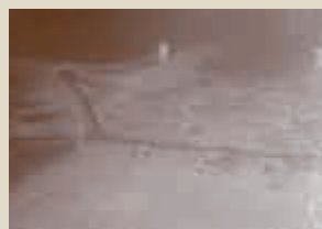
▲内風呂の床 温泉成分が何層にも重なる内風呂の床