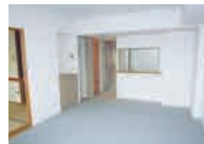
家族や親せきとの会話がはずむ空間へ