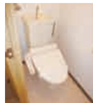
最新タイプのトイレをご提案