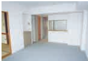
家族や親せきとの会話がはずむ空間へ