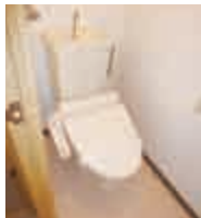
最新タイプのトイレをご提案