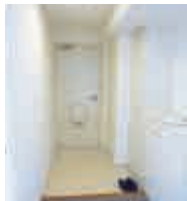
すっきりとした玄関周りをご提案