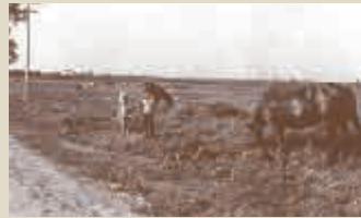
昭和30年頃の手稲駅北側の風景 左手は樽川通

Information ■住所:札幌市東区東苗穂4条2丁目2番地1 ■建築年:1990年 ■階建:9階建 ■総戸数:89戸 ■学区:東苗穂小学校/札苗中学校