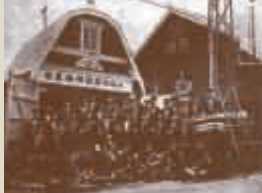
参考文献 『手稲でみつけた手稲のはなし』 発行:札幌市手稲区役所市民部総務課 野火の消火で活躍した地域の消防団 ▶ (手稲消防団刊「あゆみ」)