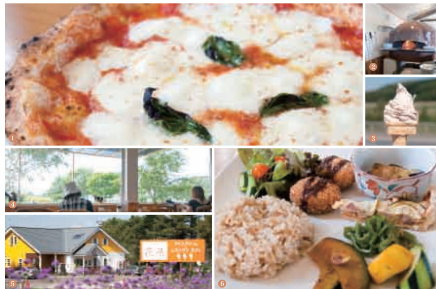
①ピッツアの定番「マルゲリータ」Lサイズ1,080円②ナポリ製の石窯で焼かれたピッツァは絶品!③アイスクリーム(渋皮つき栗)シングルサイズ260円④美しい農村景観が見渡せる明るい店内⑤大自然に囲まれた鮮やかな黄色が印象的な外観⑥道産米「おぼろぎ」の玄米ご飯と花茶農園産の野菜を主にしたランチプレート「玄米ごはんのプレート(スープ付き)」800円