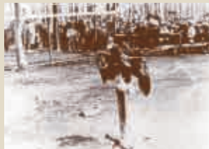
◀ オオワシの「バーサン」昭和26年撮影

円山と言えば、閑静な住宅街で人気のエリアですが、様々な施設がある事でも知られています。その中でも多くの方が一度は行ったことがあるでしょう。円山動物園は、戦後間もない昭和26年5月5日、この日に開園しました。開園時に飼育展示されていた動物はわずか三種四点。購入したヒグマ二頭、稚内市から寄贈されたエゾシカ、そして望来村で小学生が捕獲したオオワシのみでした。それにも関わらず、動物園には連日数千の市民が押し寄せました。しかし、動物が少な