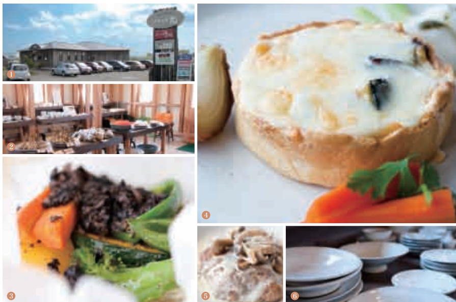
①江別西インター線沿い入口②新鮮な野菜がおしゃれに並ぶ店内③畑の恵みランチ(パンバイキング)「秋野菜の包み焼き」1,280円 ④畑の恵みランチ(パンバイキング)「秋野菜のキッシュ」1,380円⑤地元江別のお米と当別のSPF豚を使った風の村ランチ「ハンバーガー(クリームソース)」1,280円⑥レストランの敷地内にある「アトリエ陶」の手作り陶芸品

「収穫の秋」そして「食欲の秋」。北海道がいちばん美味しい季節になりました。今回は、秋の味覚を堪能できる編集部オススメの2件をご紹介します。