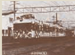
参考資料 『南区のあゆみ』 発行: 札幌市南区役所総務部総務課

山溪周辺の森林から切り出される木材や石材の運搬を目的として敷設されました。この鉄道が開通して大きく変わった定山溪は、昭和に入ると頃から札幌の奥座敷として賑わいをみせます。さらに昭和32年に定鉄は札幌駅まで乗り入れが可能になり、市民に大いに利用されていきました。しかしながら、自動車の普及で踏切の危険性が問題になったことや、地下鉄の建設が始まったことなどにより、昭和44年10月に廃止されました。現在は自動車が行き交う南区ですが、鉄道の歴史があつたこと、大切な歴史として語り継いでいきたいものです。