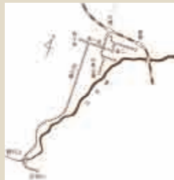
◀大正中期の馬鉄路線図

道庁赤レンガ庁舎や豊平館などが、この石材を使用して残っています。現在では一日三万台もの車