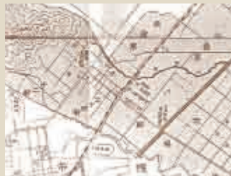
◀琴似村全図(大正15年)

■住所:札幌市厚別区青葉町3丁目435-336 ■建築年:1997年 ■階建:(A棟)11階建 (B棟)9階建 ■総戸数:86戸 ■学区:青葉小学校/青葉中学校