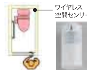
ワイヤレス 空間センサー

在宅時の生活リズムを見守るサービスです。一定時間を超えても、トイレの利用がない場合を異常と判断し、CSPが駆けつけます。お一人暮らしの方でも「安心」です。