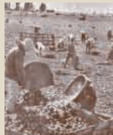
▲昭和25年頃のタマネギ畑の収穫風景

在の東区)が日本のタマネギ栽培発祥の地と言われており、札幌村郷土記念館には「わが国の玉葱栽培 この地にはじまる」と刻まれた記念碑があるほどです。この札幌村にアメリカ産の「イエロー・グローブ・タンバース」という種が持ち込まれたのが1871年(明治4年)頃と言われています。しかし、栽培の歴史は様々な試行錯誤があったようで、タマネギが商品として流通し、主産物として農家の生活が可能であることに目処がつくまで、10年以上の年月がかかったそうです。その後も土づくりや農具の工夫、特に乾燥機の改良は、収穫後に痛みにくく長持ちするタマネギにすることが可能になり、商品の価値を向上させたと言われています。また市場の開拓にも積極的に取り組んだそうです。