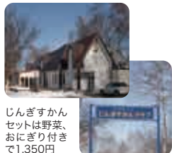
ジンギスカン セットは野菜、 おにぎり付き で1,350円