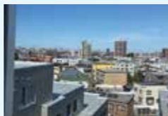
札幌市の街並みを一望できる眺望