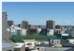
第一高校のサッカーグラウンドを望む開放的なロケーション

築平成4年・80戸のマンションを一人で担当しています。日々の清掃やゴミ管理、防犯の見回りなどを行いながら、入居者の方々とおしゃべりしたり、お子さんが笑顔で手を振ってくれたり、日々のふれあいも大切にしています。駐車場のことなど細かなご相談にも対応し、安心して暮らせる環境づくりを心がけています。