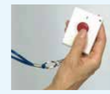
見守りコントローラー