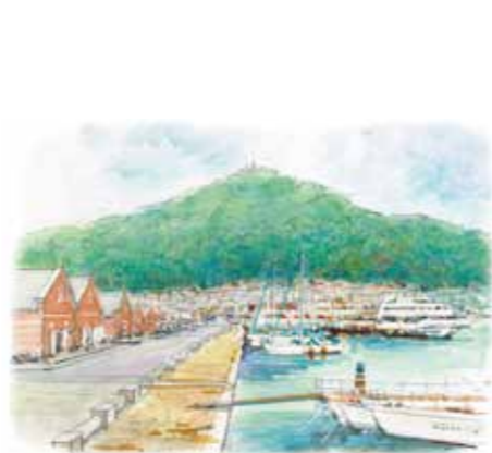
絵 榎木 博史

話し合ったことをみらいノートやメモに記しておくことも大切ですね! どうぞイメージしてみてください! 病院のベッドで沢山の管に繋がれて最期を迎えたいでしょうか? 住み慣れた自宅で家族のぬくもりを感じながら逝きたいでしょうか? 選択できる自由を真剣に考えてみてください! 家族で話し合う人生会議の時間を大事に致しましょう。