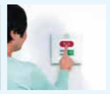
ワイヤレス緊急ボタン