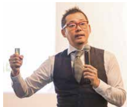
株式会社ルーツ・オブ・ジャパン 代表取締役

1975年札幌市消防局に奉職し、幅広い業務に従事。有珠山噴火災害では、道内広域消防応援隊及び緊急消防援助隊の総括指揮。その後、札幌市危機管理対策室の危機管理対策課長など歴任し、2011年4月から現職。