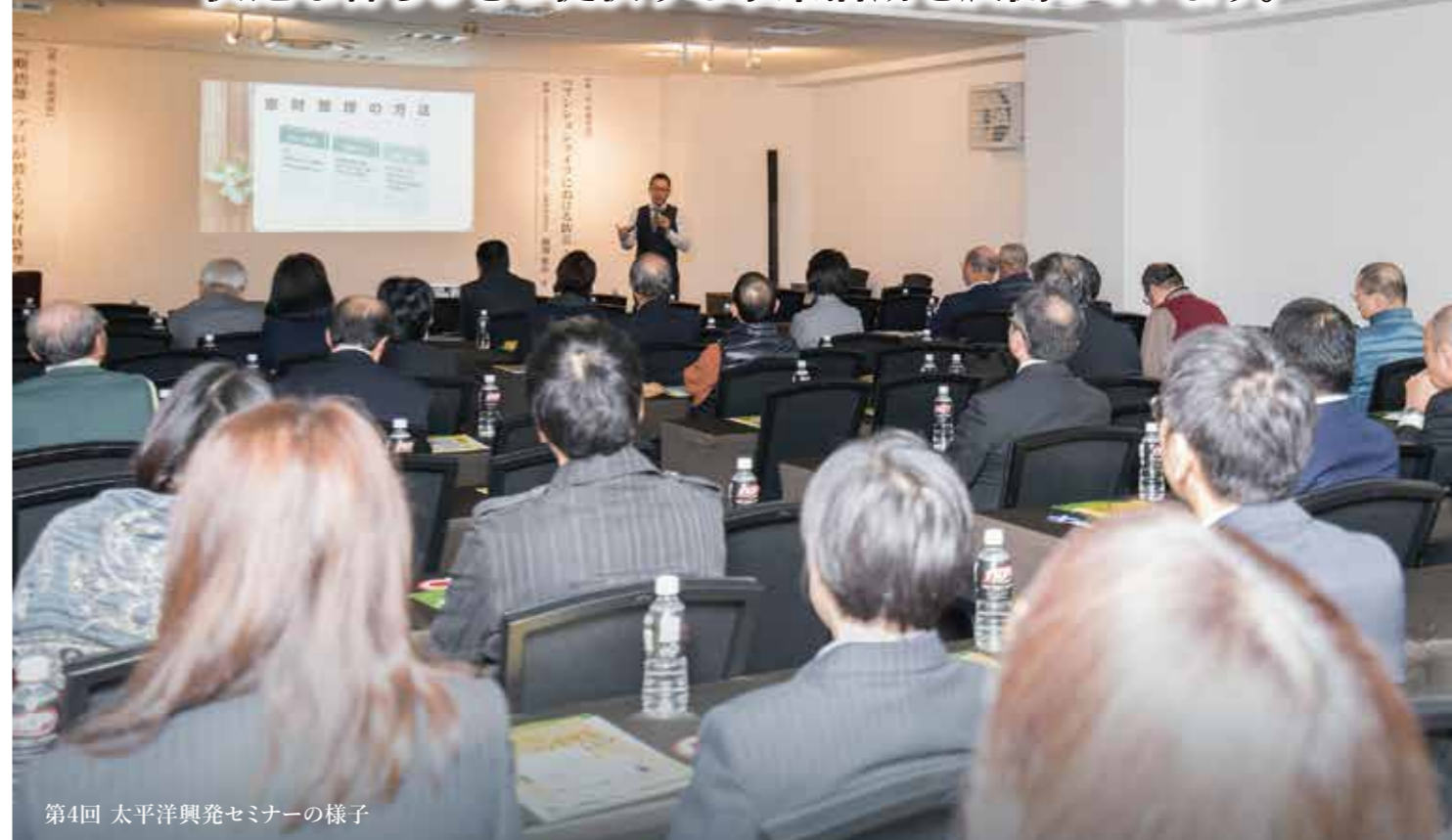
第4回 太平洋興発セミナーの様子

私たち太平洋興発グループは、 快適な暮らしをご提供する事業活動を展開しています。