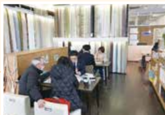
39組の方にご来場いただきました。