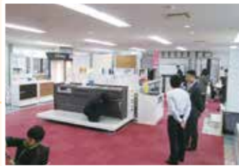
45組の方にご来場いただきました。