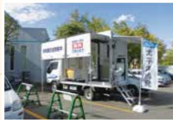
20組の方にご来場いただきました。