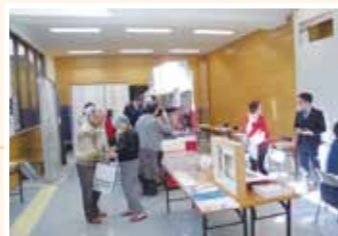
23組の方にご来場いただきました。

管理会社が開催するリフォーム相談会ということで、細かな点まで配慮したご提案が可能になっています。ぜひリフォームをご検討のみなさまはお気軽にご相談ください。