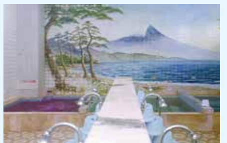
壁面いっぱいには雄大な富士山が描かれる