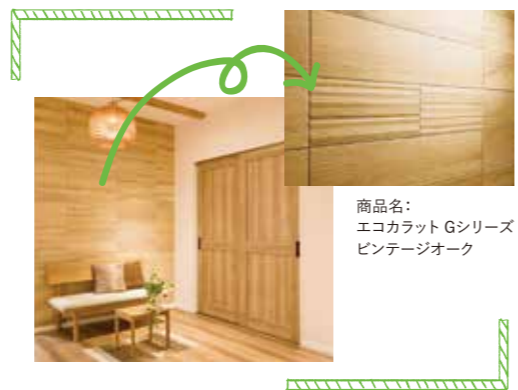
商品名：エコカラット Gシリーズ ビンテージオーク

お部屋の湿気やニオイにお困りな方多いのではないのでしょうか？ そんな方にオススメなのが、写真の壁に使われている「エコカラット」という商品です。一見すると木の壁に見えますが、特殊な焼き物の素材で、吸放湿量は珪藻土の約5倍、調湿壁紙の25倍以上と言われています。色々なデザインがあるので、絵のように飾っても良いですね。