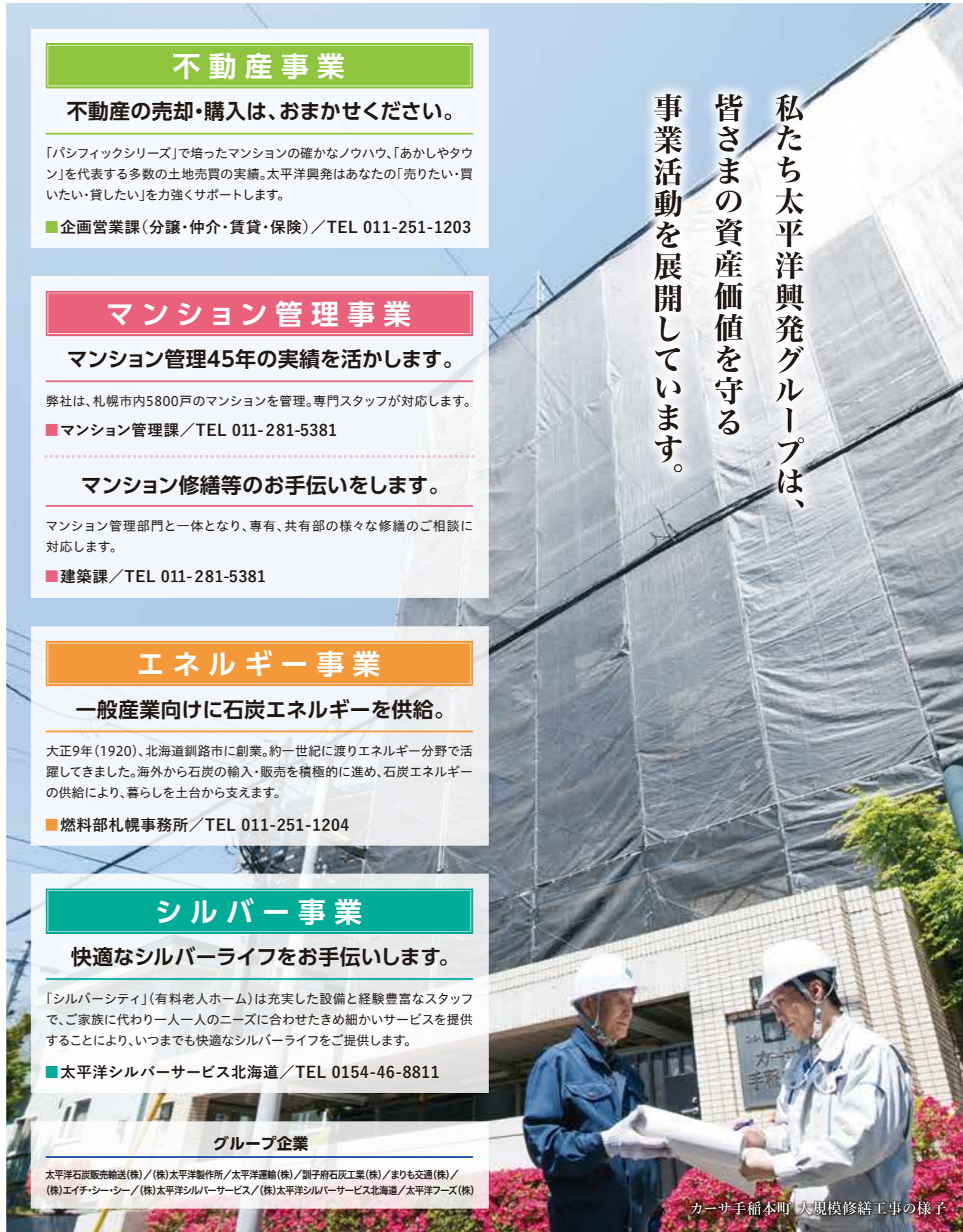
カーサ手稲本町 大規模修繕工事の様子