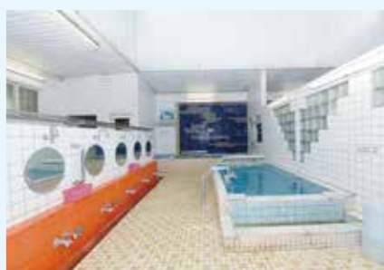
磨き上げられた清潔感が心地良い