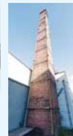
レンガの高い煙突