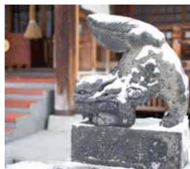
～日々の生活を豊かにする場所～

初詣に行った方も多いでしょう。今回の表紙は北海道神宮頓宮の狛犬です。こちらの頓宮は北海道神宮の遙拝所として明治11年に設置されました。その頓宮の狛犬ですが、縁結び・子宝運のご利益がある隠れ人気スポットなのをご存知ですか？ご存知ない方は、一度その理由を確かめに訪れてみるのも良いですね。