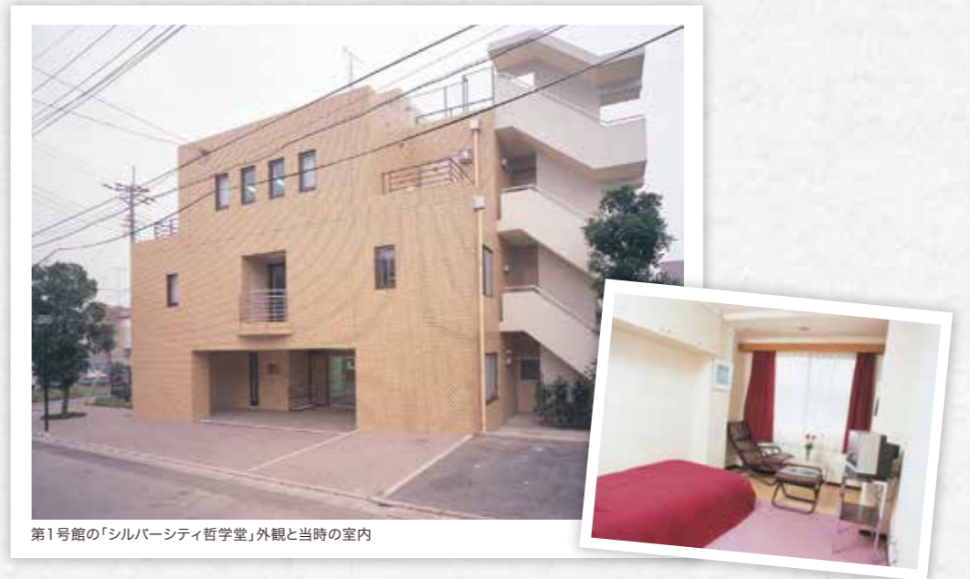
第1号館の「シルバーシティ哲学堂」外観と当時の室内