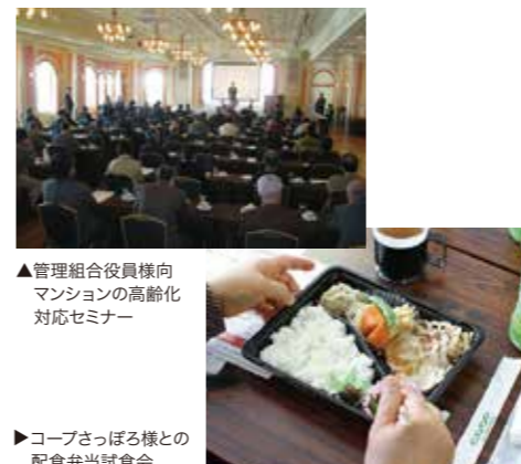
▲管理組合役員様向 マンションの高齢化 対応セミナー