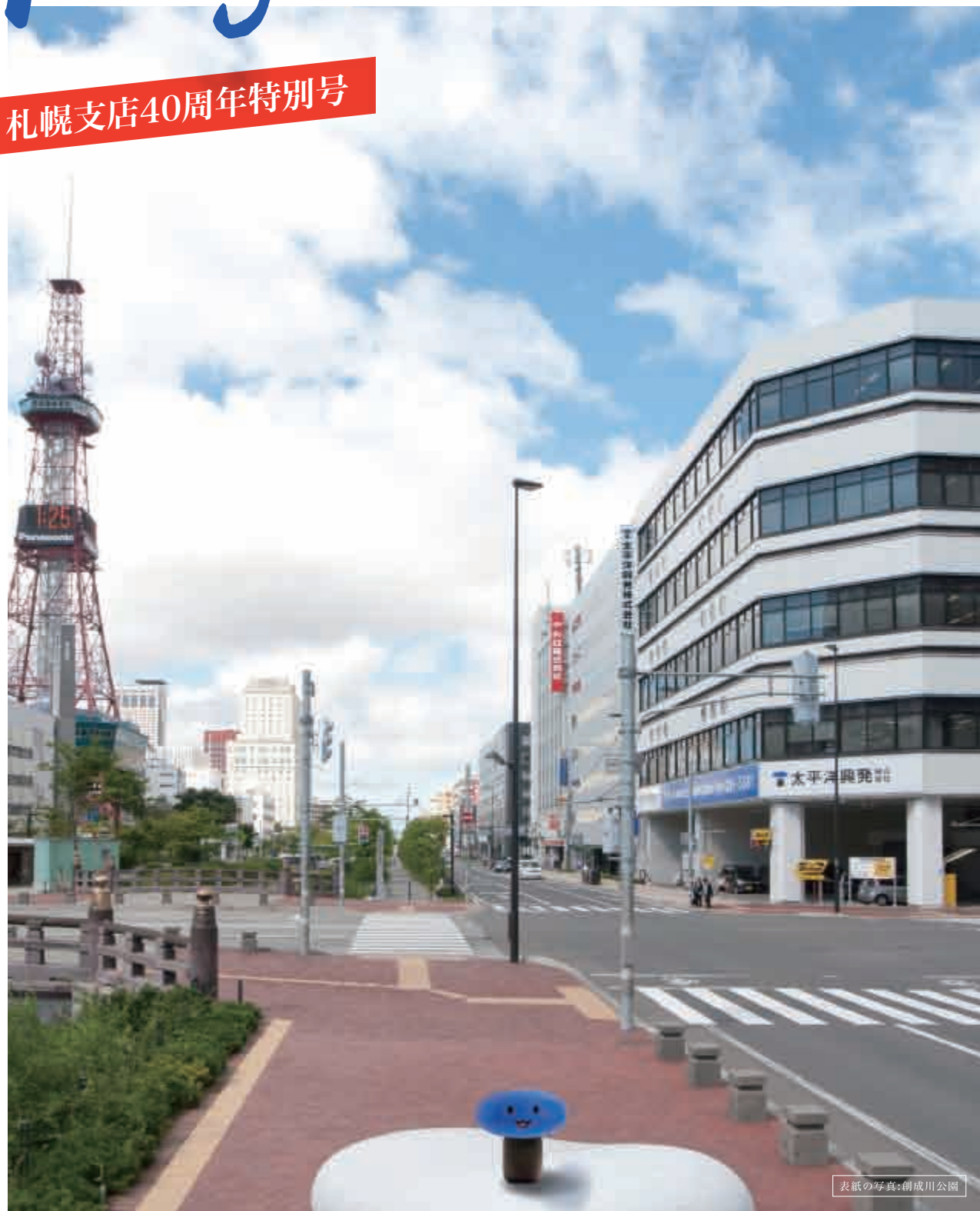
表紙の写真: 創成川公園